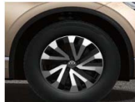
Легкосплавные колесные диски Concordia 8J x 18 (P2F)