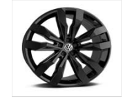
Легкосплавные колесные диски Suzuka 9,5J x 21 (P16)