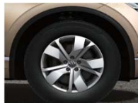
Легкосплавные колесные диски Cordova 8J x 18 (P2E)