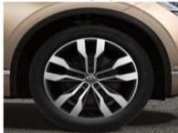
Легкосплавные колесные диски Suzuka 9,5J x 21 (P15)