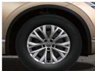
Легкосплавные колесные диски Cascade 8J x 18 - стандарт для Respect