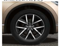
Легкосплавные колесные диски Braga 9J x 20 (P14)