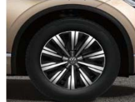
Легкосплавные колесные диски Tirano 8,5J x 19 (P1C)