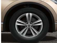
Легкосплавные колесные диски Sebring 8,5J x 19 (P1D)