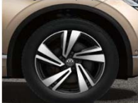
Легкосплавные колесные диски Nevada 9J x 20 (P12)