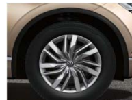
Легкосплавные колесные диски Osorno 8J x 19 (P1B) - стандарт для Status и R-Line